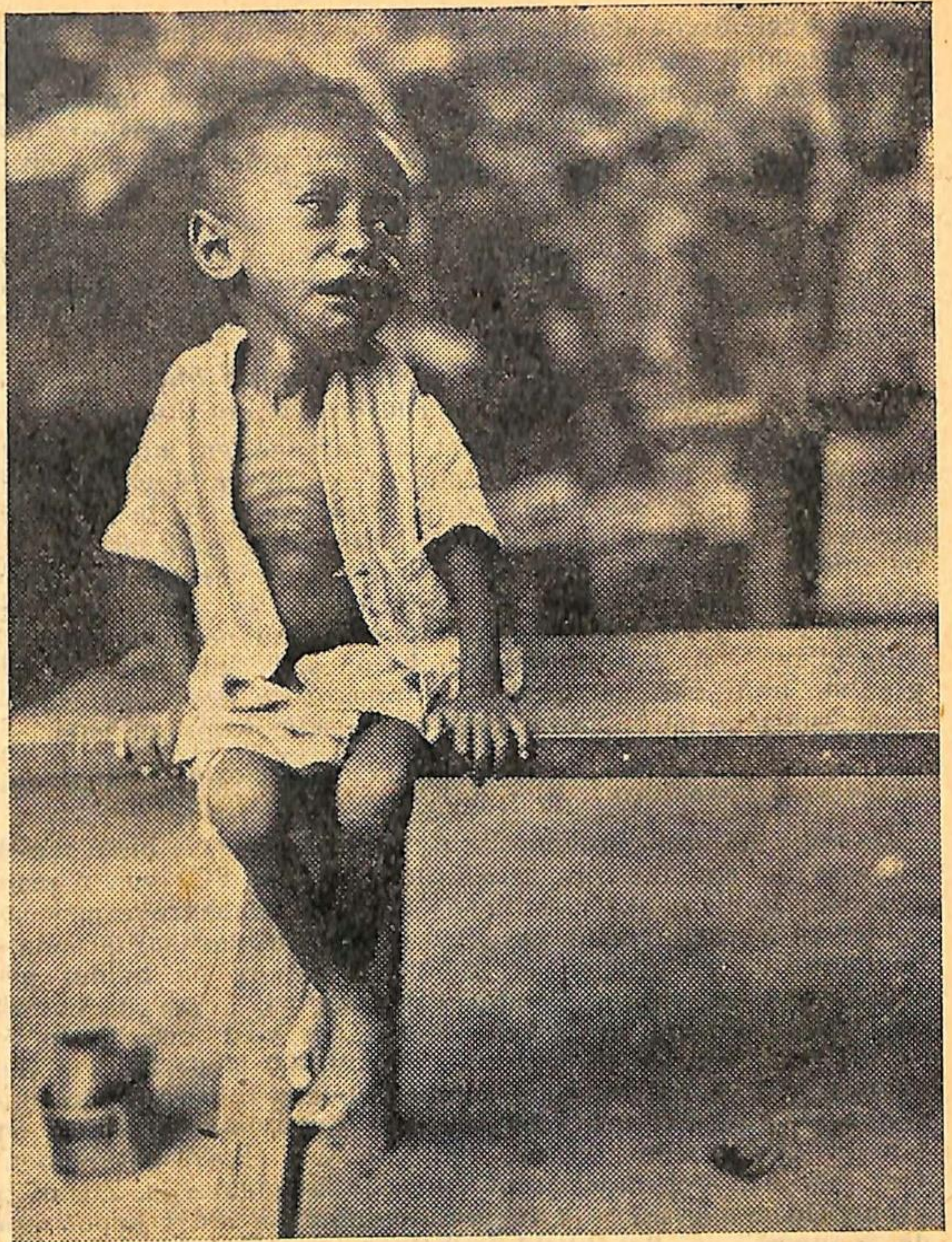
Een Ambonneesch jongentje, wiens leven onder Japan's hongerbewind zoo tragisch begon, wordt in een Nica-hospitaal opgekweekt.

Het eten wordt centraal door hen zelve bereid en is behoorlijk. Het is beter dan in Batavia, beter dikwijls ook dan