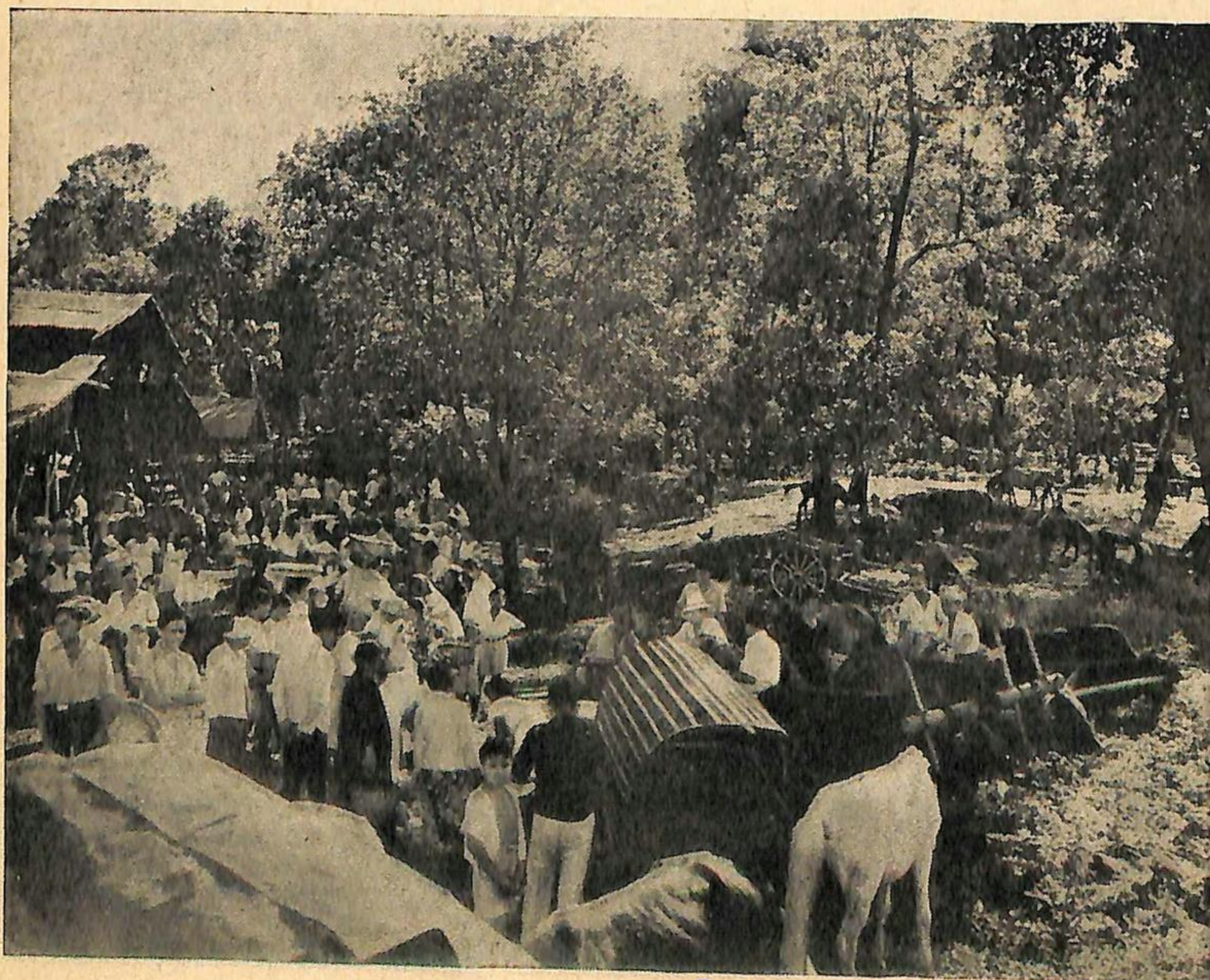
Het andere indie: rustig vertier op de pasar van Tomohon in Noord-Celebes.

In de thans ontstane situatie speelt het gebrek aan politieke scholing een groote rol; er is in het nationalistische kamp niets gedaan om zich voor te bereiden, deels omdat de daarvoor noodzakelijke gesteldheid, het inzicht, de politieke scholing, de intellectueele capaciteit in veel te geringe mate aanwezig is — deels uit typische onlust. Het is nu zoo lang goed gegaan... de ontwikkeling van zaken was tot zekere hoogte te vergelijken met een openluchtspel, waarin men, improviserende, heel de wereld tot zijn toeschouwers maakte. Zoo men haar niet épateerde , men bracht haar althans tot verbazing en tot ontzetting — en werd er niet op vele rangen geapplaudisseerd? Nu intusschen verandert het beeld en het podium moet worden verwisseld voor de conferentietafel, waaraan men niet zulk een indrukwekkende rol zal spelen. De neiging om zich daaraan te onttrekken is vanzelf sprekend wel zeer sterk. Voorloopig kan men zeggen , dat men met niets minder tevreden is dan met 100 procent onafhankelijkheid — baat het niet, het schaadt allicht niet en het is in ieder geval in de lijn der fermheid = brani mati . Het is niet omdat men dit in al zijn consequenties als het meest verkieslijke standpunt heeft uitverkoren; het is de vlucht en anders niet... de vlucht uit het verantwoordelijkheidsbesef en als zoodanig past ook deze