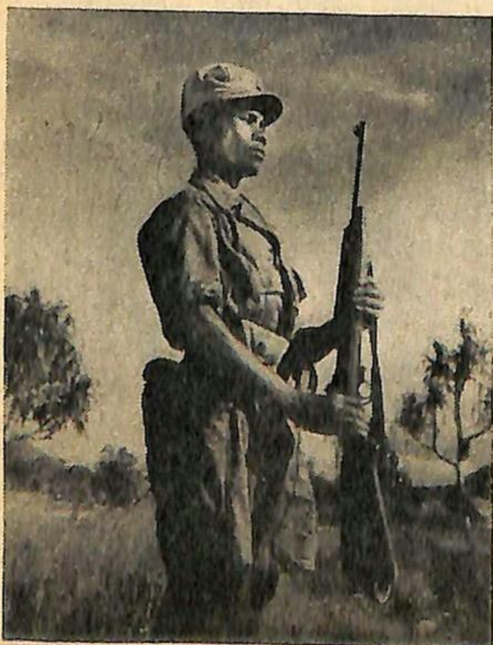
Het andere Indië: Papoea van het vrijwilligersbataljon van Papoea's van het Kon. Ned. Ind. Leger.

Het leven wordt hier beheerscht door de AMACAB