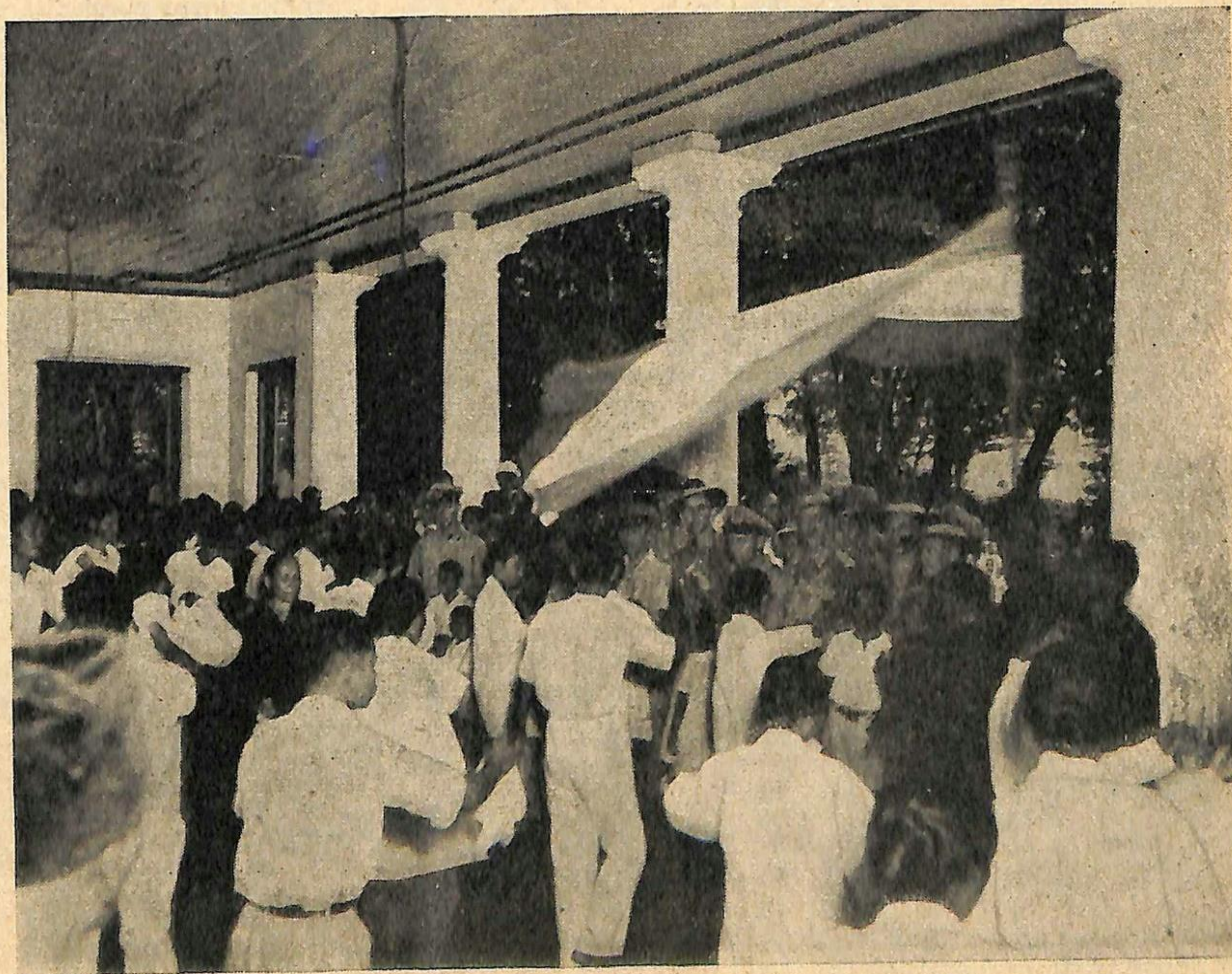
Het andere Indië: de Nederlanders verwelkomd op Banda; men danst bij de driekleur de menari-dans.