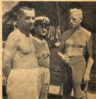
Overlevenden van den slag in de Java-zee wachten in een kamp in Siam nog op de bevrijding . . .

Landgenooten! Deze mannen zijn na 3½ jaar van het ergste lijden, dat een mensch kan doorstaan, opnieuw in uniformen gestoken en zijn thans bezig. . . . Nederlandsch-Indië te bezetten. . . . Sommigen hunner, de gelukkigsten, zagen hun vrouwen gedurende eenige dagen of weken, om toen opnieuw te scheiden, voelt u, landgenooten: na 3½ jaar opnieuw scheiden. . . . De meesten echter zagen hun vrouwen in het geheel niet, 7 maanden na de capitulatie, hun vrouwen zijn nog op Java, of, heel gunstig, misschien in Holland. Maar nog zonder hun mannen, thans na 4 jaar en 2 maanden. Toen wij de Hol-