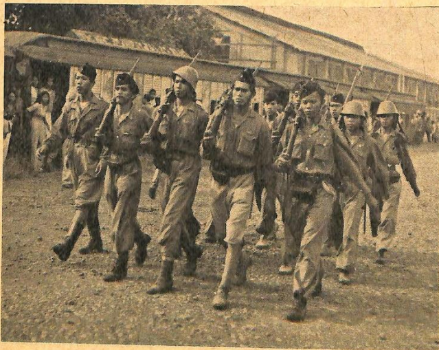
Een troepje soldaten van de T. R. I., het leger van de „Republiek”. Een deel hunner uniformen is Japansch, hun opleiding was Japansch, en al hun wapenen zijn Japansche wapenen.