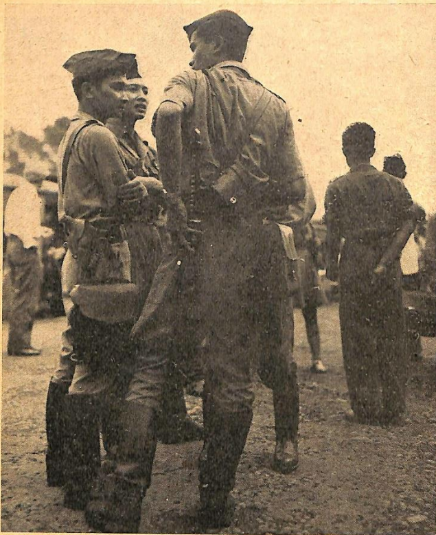
Kader van de T.R.I., het leger der „Republiek” Men lette op het Japansche Samoerai-zawaard...

langrijke gevolgen daarvan tot op den huidigen dag, kom ik in ander verband terug. Om voorloopig de groote lijn in het oog te houden, kunnen wij vaststellen, dat eerst veel later in Indië een ontwikkeling begint, waarbij de beide sferen, de Nederlandsche en de Oostersche, in nauwere aanraking met elkaar komen en gedeeltelijk in elkaar beginnen te schuiven; maar ook dan is er geen sprake van eenige aandrift tot vernietiging van het Oostersche, wel van een neiging tot overbrugging en samenschakeling.