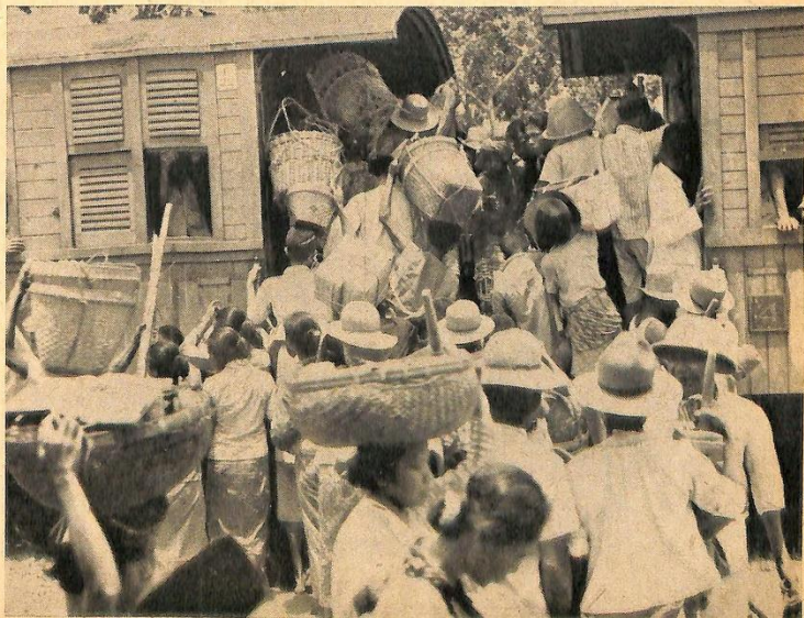
Spoorwegverkeer op Java in 1946

De straatgevechten waren niets anders dan een kinderachtige en kinderlijke comédie, waarom men eigenlijk lachen moest. De langs de straten oproerige bendeties, grootendeels bewapend met pieken, waren net troepen schooljongens, zoals wij die gekend hebben in onze jonge jaren, als de scholen tegen elkaar vochten. Werd de overkant (de Japs!) een beetje agressief, dan verdween men retireerende als een haas in gebouwen en achter muren om Joelende weer te voorschijn te komen als het weer een beetje veilig was. Had men dit in de kiem gesmoord, dan waren we nu een heel eind verder geweest.