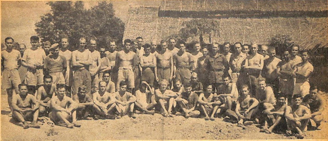
Nederlanders, die acht maanden na Japan's capitulatie nog in een kamp in Siam verblijven