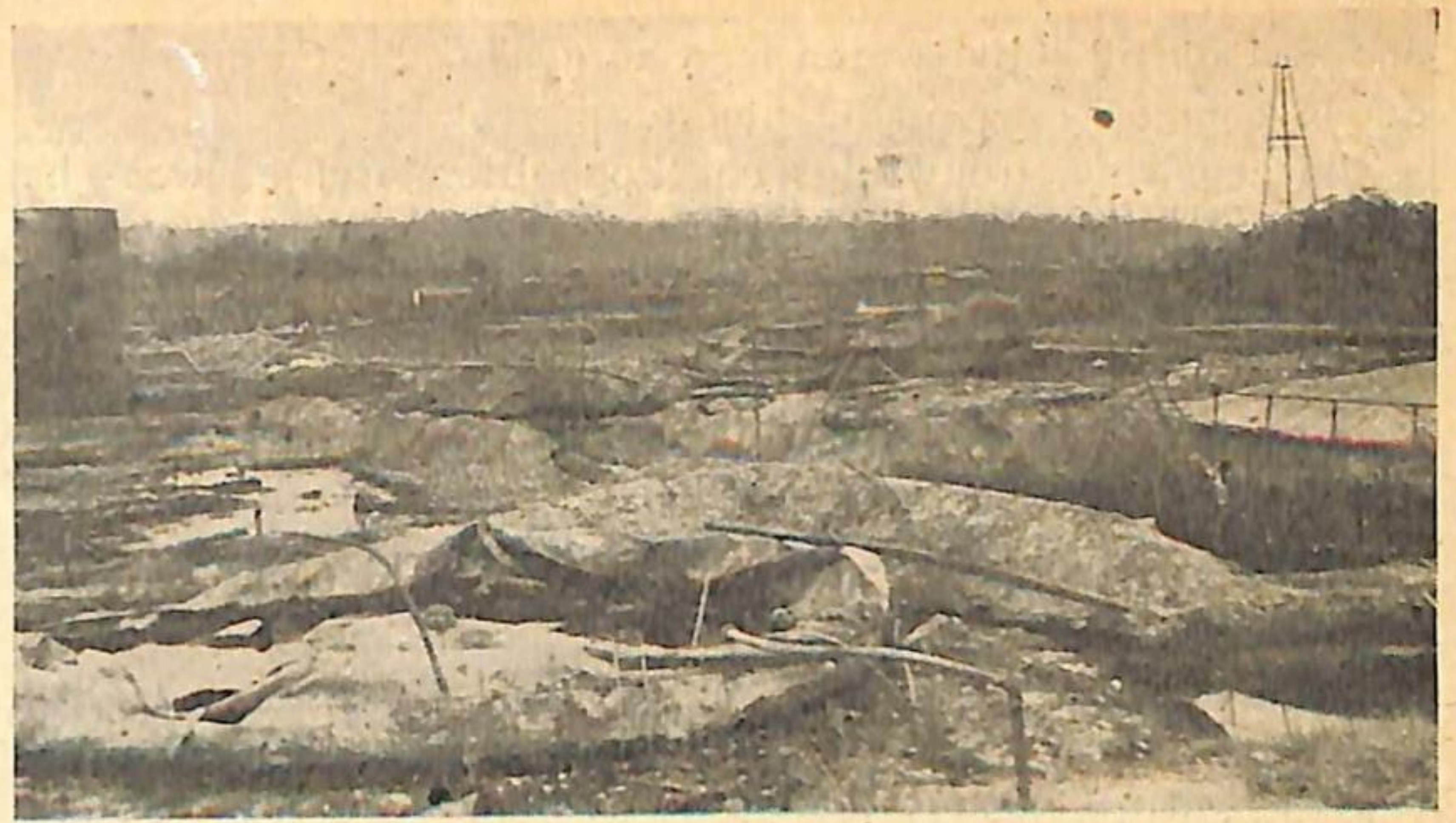
De vernielingen van de olieterreinen van Tarakan.

Op 13 November werden we op transport gesteld. Een kofertje en een bultzak mochten we meenemen. Ons heele hebben en houden, alle dierbare herinneringen, vielen de Jappen in handen. Eerst zijn we naar Solo gebracht, met zijn 250en in bilikken loodsden, zooals de schaapskooien op de veluwe. Hard werken, 't land patjollen, boomen hakken, beerputten leegen