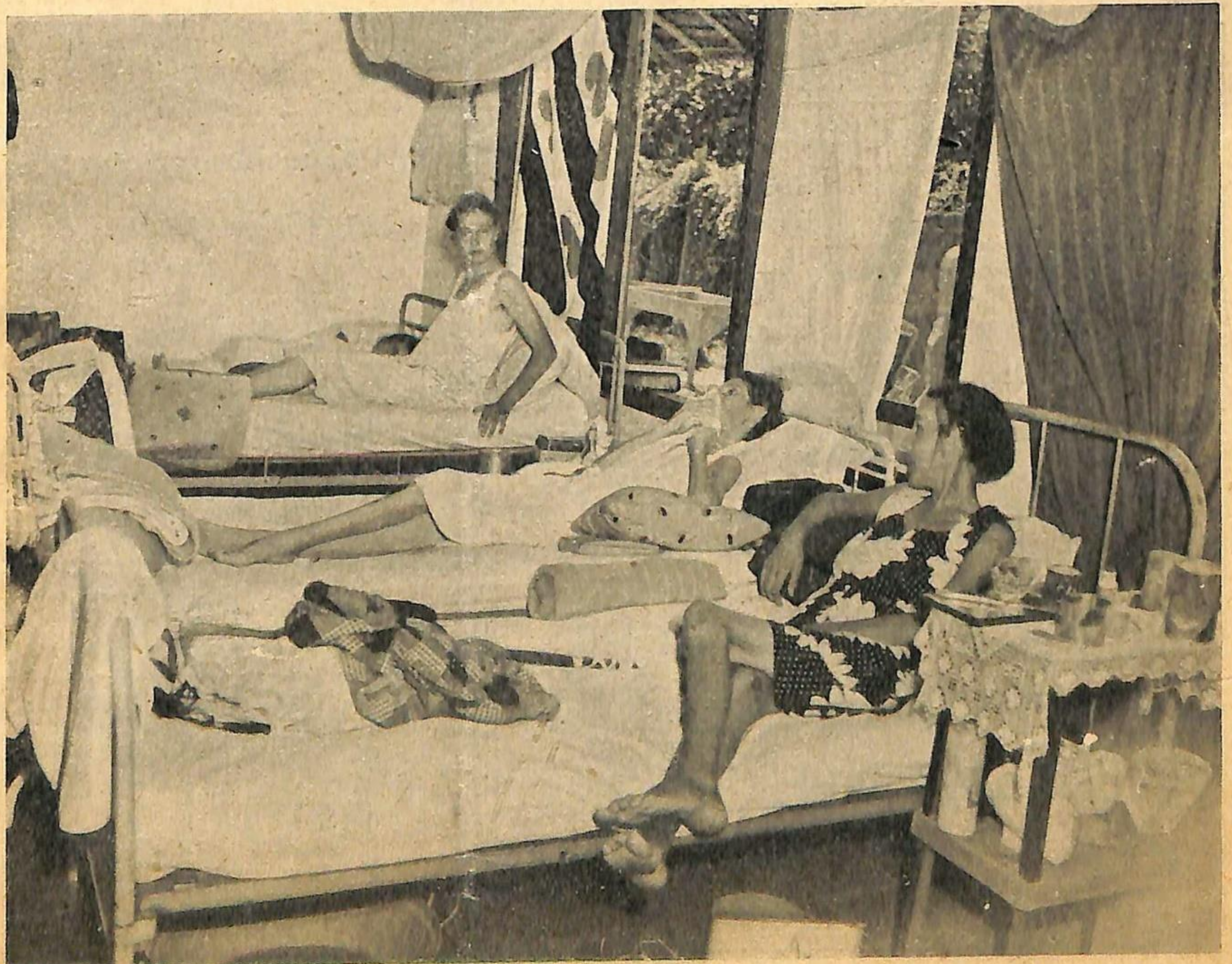
Slachtoffers der Japanners, bevrijd uit het beruchte Tjideng-kamp, rusten nu uit in het hospitaal te Batavia.

Ons tijdschrift zal naar vermogen trachten licht te verspreiden over het grootsche werk, door Nederland in Indië verricht, in samenwerking met de volken daar, over het zoo wijs, ge-