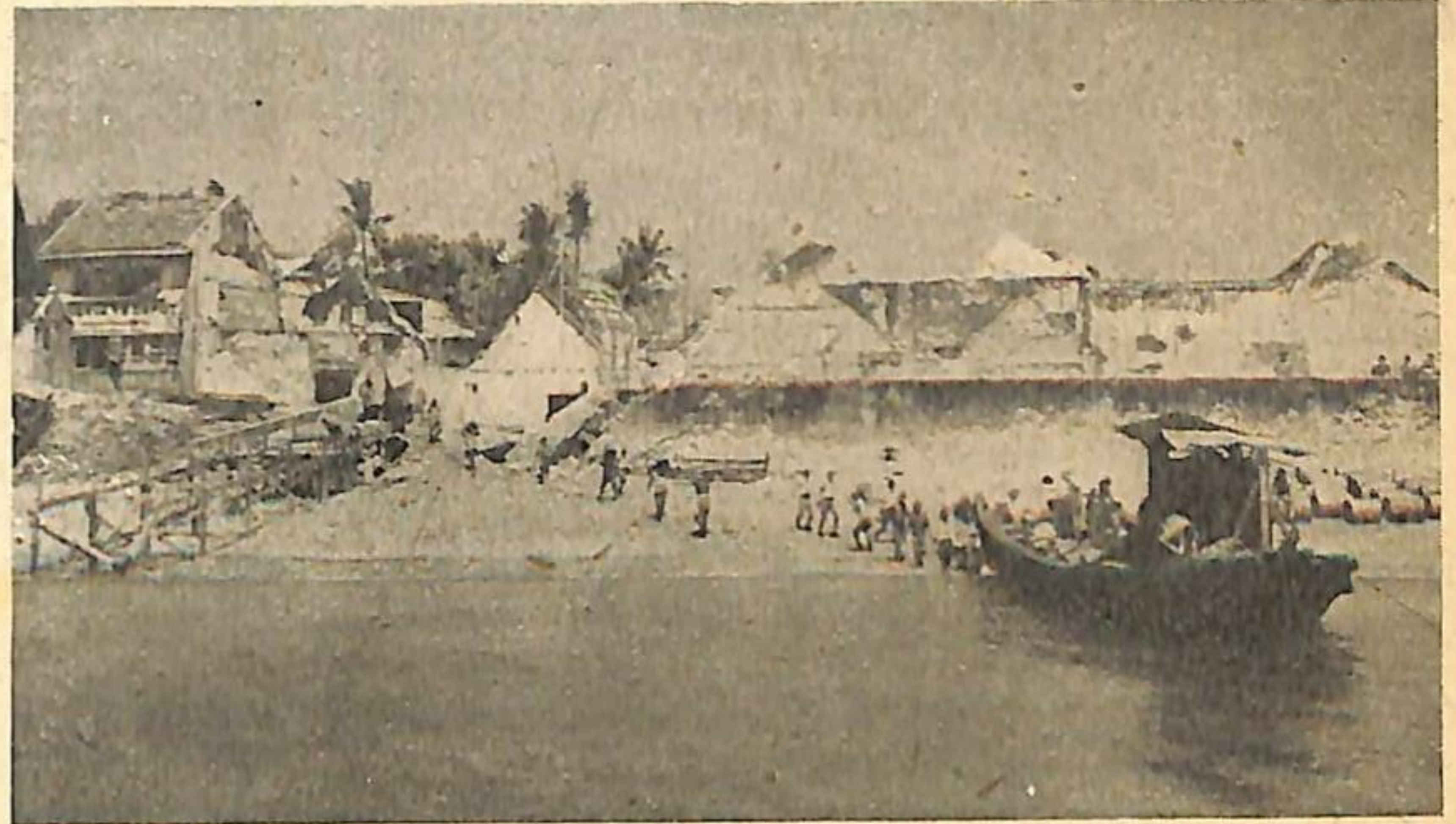
Te Koepang werken Japanners bij het lossen van schepen, onder leiding van Australiërs.