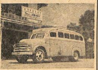
Telepon S. 4312