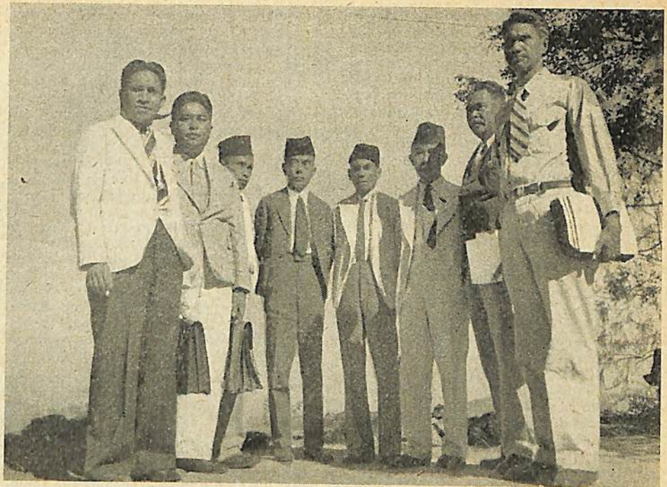
Een groep van vertegenwoordigers uit Flores, Soembawā en Timor. In het midden gekleed in het donker is de sultan van Soembawa.

Van alle centra op Sumatra, waar eenmaal leven en vertier heerschte, is Padang thans de meest droefgeestige. Binnen een kooi van prikkeldraad, zeshonderd meter lang en zeshonderd meter breed, trachten drieduizend menschen, waaronder vierhonderd-en-vijftig Europeanen, zich voor te stellen, dat de oorlog al sinds bijna een jaar tot het verleden behoort. Maar nagenoeg iederen nieuwen grauw dag vliegen de handgranaten over het prikkeldraad. Het zijn primitieve wapens, vermoedelijk in Fort de Kock vervaardigd, een brok ijzer met een lont er aan. Maar de uitwerking kan verschrikkelijk zijn. Soms zijn het ook flesschen, met dynamiet gevuld. In vele gevallen wordt de aanval ingezet met katepulten, waarmee de „tentera semoet” geweldige brokken steen binnen de omheinde veste slingert. De „tentera semoet”: dat zijn de opgehitste Minangkabausche jongens van 12 tot 14 jaar. Ze vormen altijd de voorhoede van een of anderen terroristen-aanval. De terreurleiders van de Westkust hebben namelijk ontdekt dat een blanda „stom” genoeg is niet op kinderen te schieten. Zoo jagen zij dus hun kroost vooruit als het kamp weer eens in onrust moet worden gebracht. De kooi van prikkeldraad heeft twee uitwegen: naar Emmahaven en naar het vliegveld. Op beide punten ligt