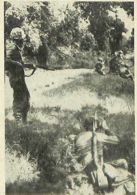
Onze troepen in actie.

Spoedig was het rustig en kon de plaats overgenomen worden door een achter ons aan komende compagnie, want onze taak was nog niet afgelopen.