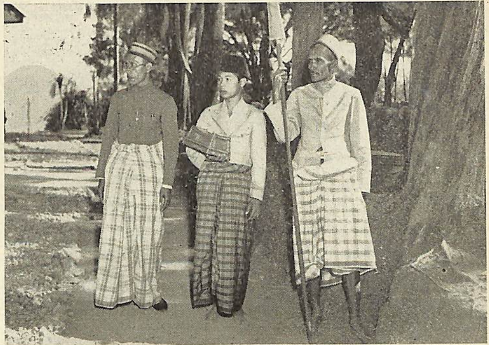
De dragers van de rijkssieraden van Goa, het rijk op Celebes, waar de conferentie van Malino gehouden werd.

Beloften, zoo gevaarlijk, onverantwoord en ongrondwettig als deze, zijn ook door volgende regeeringen moeilijk in te trekken. De huidige minister van Overzeesche Gebiedsdeelen, Jonkman, zit er dan ook mee en het is voor den gewonen burger bezwaarlijk uit te maken, hoe hij er over denkt. In de troonrede, gehouden bij de opening der zittingen van de nieuw gekozen Kamer, wordt wel gewag gemaakt van de radiorede van H.M. de Koningin, gehouden op 7 Dec. 1942, waarin wordt uitgegaan van de handhaving der Rijkseenheid, maar van de te kwader ure gegeven belofte, waarbij Indië zich aan het Koninkrijk zou kunnen onttrekken, wordt met geen woord gerept. Dit laatste