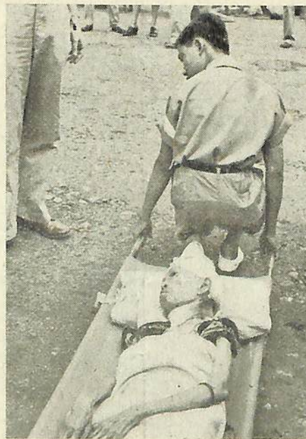
Een van de evacuë's uit midden-Java bij aankomst te Batavia.

Teneinde de merdika-beweging te bespoedigen, werd door de Soekarno-groep de gedemobiliseerde heih'o's weer opgeroepen. Er werden 400 van deze knapen