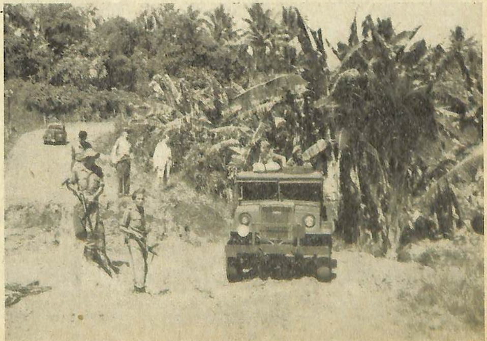
Over de geheele breedte is hier de weg door terroristen vernield, maar met verlies van den uitlaat kwam ook de bestuurswagen er door.

De illustraties werden ter plaatse gemaakt door mevr. Vogelaar-Weber. Een gedeelte van de opbrengst dezer uitgave komt ter beschikking van de Oost-Indische Kamer van het Nederlandsche Roode Kruis.