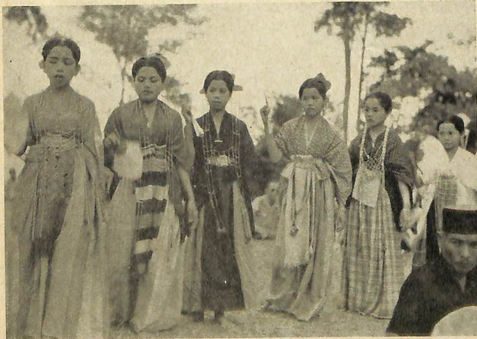
De danseressen van den danstroep van den Aramponi van Bone (Celebes) gaven tijdens de conferentie te Malino, een voorstelling in den tuin van het zwembad.

Het woord is thans aan de „desbetreffende instanties". Het zou bij het enthousiasme van den onvermoebaren technischen dienst van de P.T.T. een waardige pendant zijn, wanneer de verbinding, die zoo razend snel tot stand is gebracht, inderdaad ook binnen ieders bereik komt.