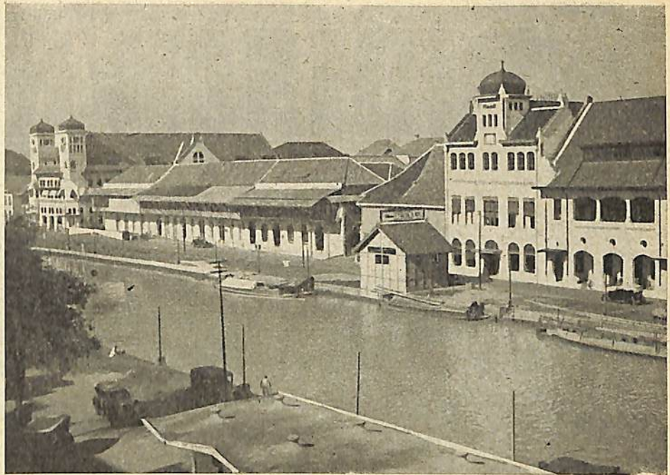
KALI BESAR, Europeesche zakenwijk te Batavia.

Toen door clandestiene radio-ontvangst in de kampen vernomen was, dat Japan gecapituleerd had en in spanning werd gewacht op de radioberichten omtrent plannen voor de bezetting van Java, was de Ned.-Indische politie gereed voor actie. De zuivering in eigen kring was voorloopig uitgevoerd, het plan van actie na overleg met de residenten vastge- steld. De verwachting was, dat de politie en de militairen terstond na de eerste landingen der Geallieerden, bevrijd zou- den worden om aanstonds hun taak op te nemen. Ondanks veler verzwakte con- stitutie waren deze mannen — zooals bijna alle Nederlandsche mannen in de kampen — volkomen bereid zich in te zetten. De politie had — door de contac- ten met de betrouwbare Inheemsche ele- menten buiten — onmiddellijk een aan- vang kunnen maken met de zuivering der verjapanschte politiekorpsen en de betrouwbare, tijdelijk tot werkloosheid gedoemde inspecteurs, hoofdagenten en agenten zouden zich binnen enkele dagen hebben aangemeld. Men had onmiddellijk de politieke en crimineele misdadigers in en buiten de concentratiekampen kunnen arresteeren en de fascistische en terroris- tische „repeobliek" ware in de kiem ge- smoord. Met de — toen nog niet in ben- den opereerende — Hei-Ho-gangsters zou- den de troepen korte metten hebben