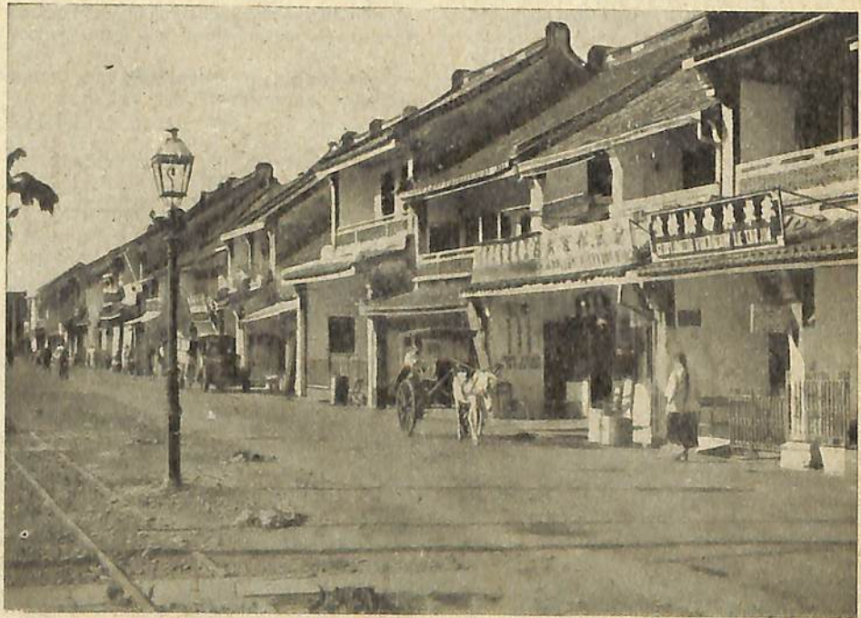
In de Chineesche zakenwijk is het niet minder druk. Hier ziet men Kongsj Besar, een Chineesche wijk, waar de nijvere leden uit het Rijk van het Midden hun zaken drijven.