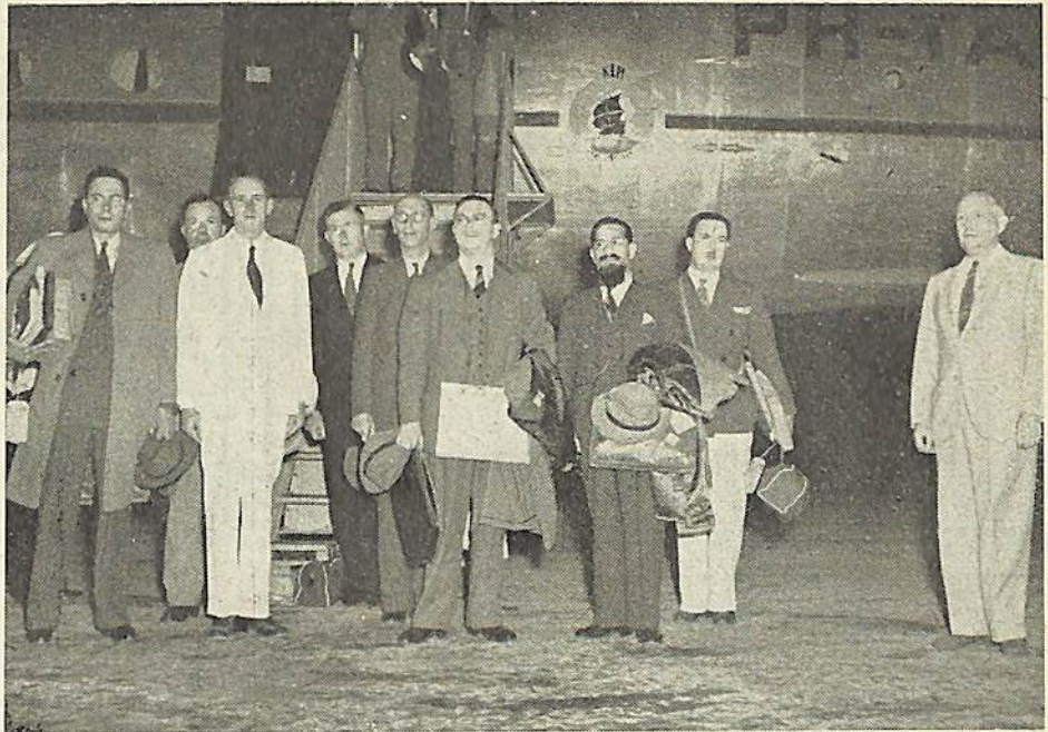
De Curaçaoese Statencommissie bij haar terugkeer op het vliegveld Hato bij Willemstad.