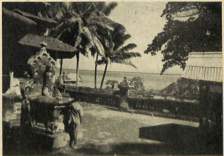
Het inwendige van een Balineeschen tempel, welke op zee uitsiet.

Het „Nationaal Verbond” — secretariaat Reinkenstraat 78, Den Haag — heeft een open brief gericht tot den Britschen minister-president, waarin krachtig wordt geïntercedieerd tegen de huidige Britsche politiek t.a.v. Nederlandsch-Indië. O.m. tegen het feit, dat de Britsche regering voortgaat de „Republiek Indonesia” te steunen, door haar gelijkwaardig met de Nederlandsch-Indische regering te behandelen. De open brief besluit: „De catastrophale politiek van uw regering beteekent een inmenging in onze binnenlandsche aangelegenheden en werpt een smet op de eer van de Britsche vlag en van het Britsche Rijk.”