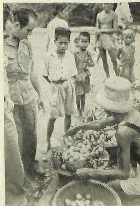
Ex-geïnterneerden doen inkoop op de Tjiknipasar te Batavia.