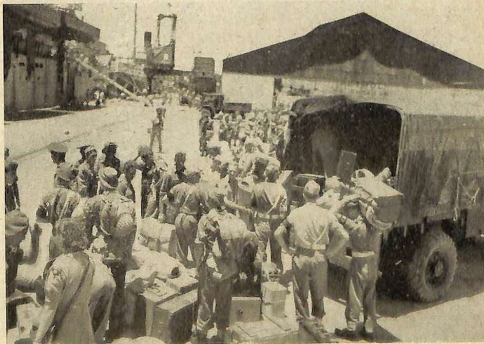
Aankomst van de Nederlandsche troepen te Tg. Priok. De bagage wordt in de trucks geladen.

Intusschen had op 23 December 1945 de luitenant-kolonel Vanoyen het bevel over Timor en Onderhoorigheden overgenomen, terwijl begin Januari een aanvulling van officieren volgde. Op 20 Maart vertrok het Australische detache-