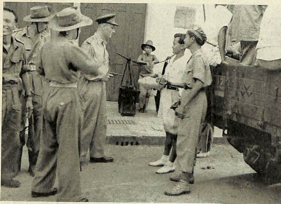
Op heeterdaad betrupt bij het verkoopen van Britsche militaire goederen op de zwarte markt.

In de Chineesche wijk is eveneens het een en ander vernield, doch ook hier valt de schade best mee. De Chineesche bewoners van Tjiandjoer hadden van de terroristen opdracht gekregen de stad te verlaten. De Chineesche burgerij heeft botweg geweigerd dit te doen, alle dreigementen van de zijde der terroristen ten spijt. Ook hier was het intusschen aan het snelle optreden van onze troepen te danken, dat de terroristen hun dreigementen niet konden uitvoeren. De Chineesche bewoners in de randgebieden der stad zijn eveneens ter plaatse gebleven. In verband met hun veiligheid werden zij later door onze troepen overgebracht naar de meer centraal gelegen stadsdeelen.