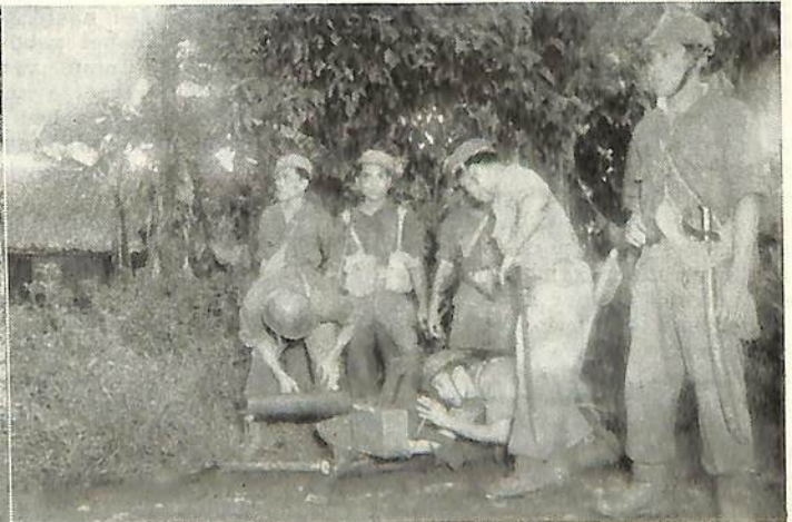
Onze troepen in Ned. Indië in actie.