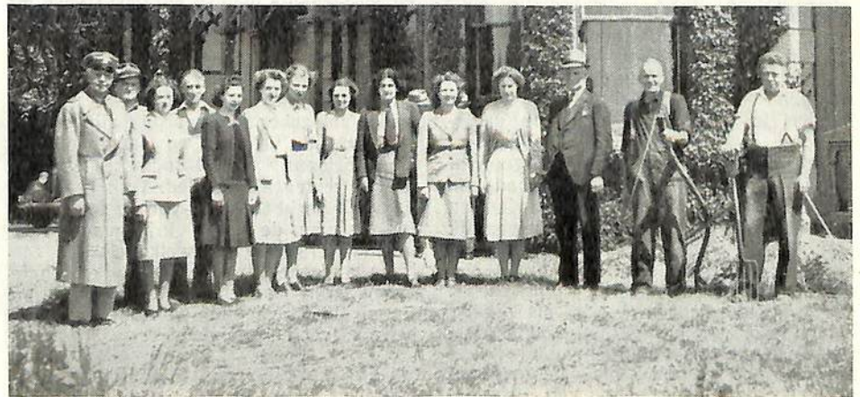
Gerepatrieerden uit Ned. Indië in Nieuw-Zeeland.

Het is op aanvraag gratis verkrijgbaar bij het C.B.D., Amaliastraat 3, Den Haag.