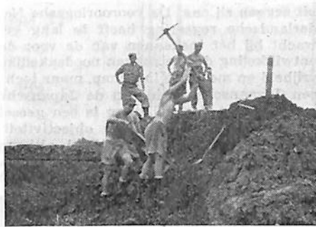
Een tankval in den weg van Batavia naar Tangerang wordt door Nederl. genietroepen dichtgeworpen.