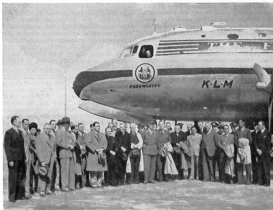
De peetooms van de „Paramaribo”.

Hun oordeel is niet verwrongen door valsche leuzen en staatkundige drogbeelden. Zij overschatten hun krachten niet en weten, dat Nederland, zoowel in de West als in de Oost, een taak te vervullen heeft. Zij weten, dat de inheemsche massa niet rijp is voor volledige staat-