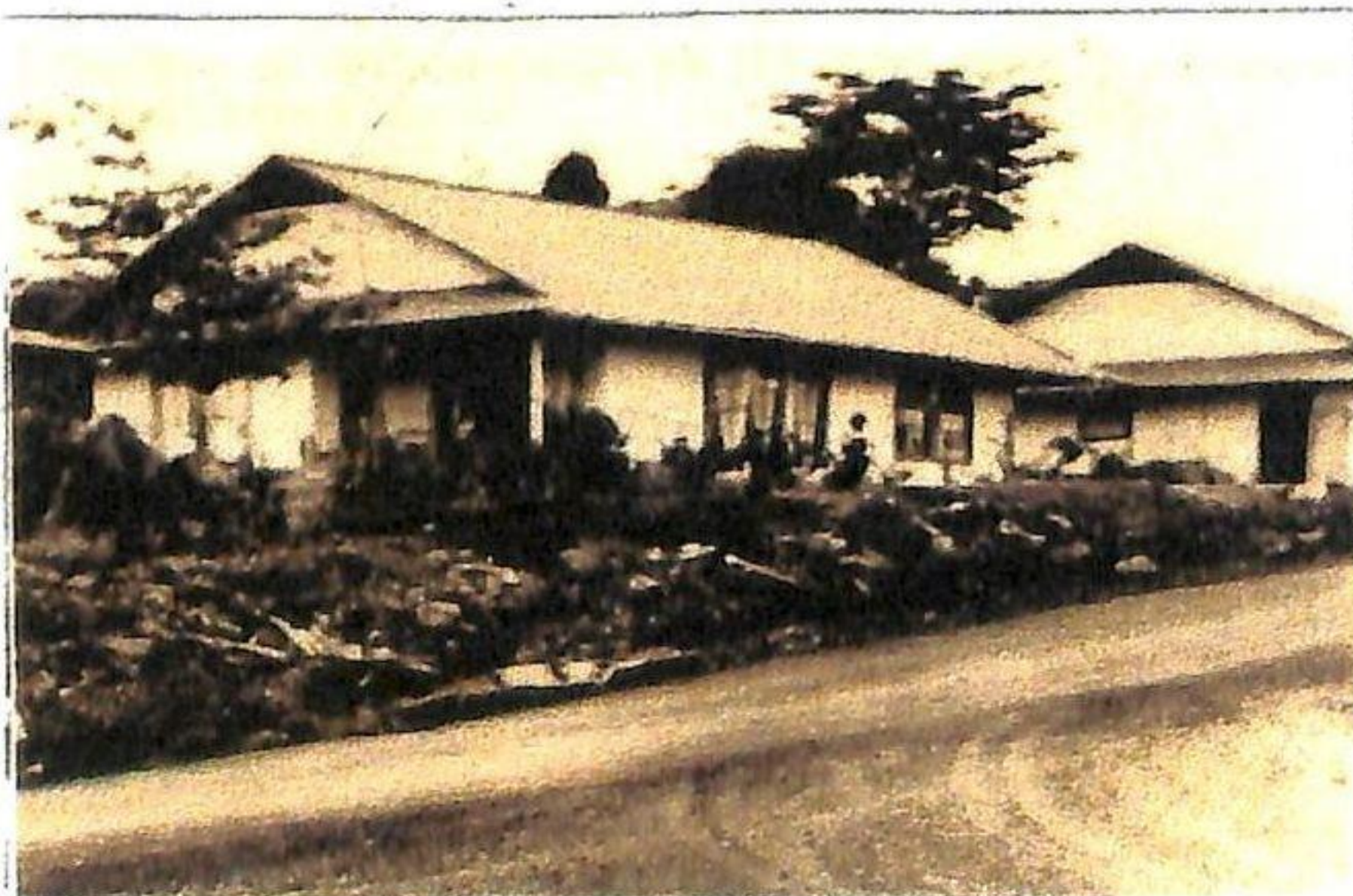
Nieuwbouw woning 1953-1962.