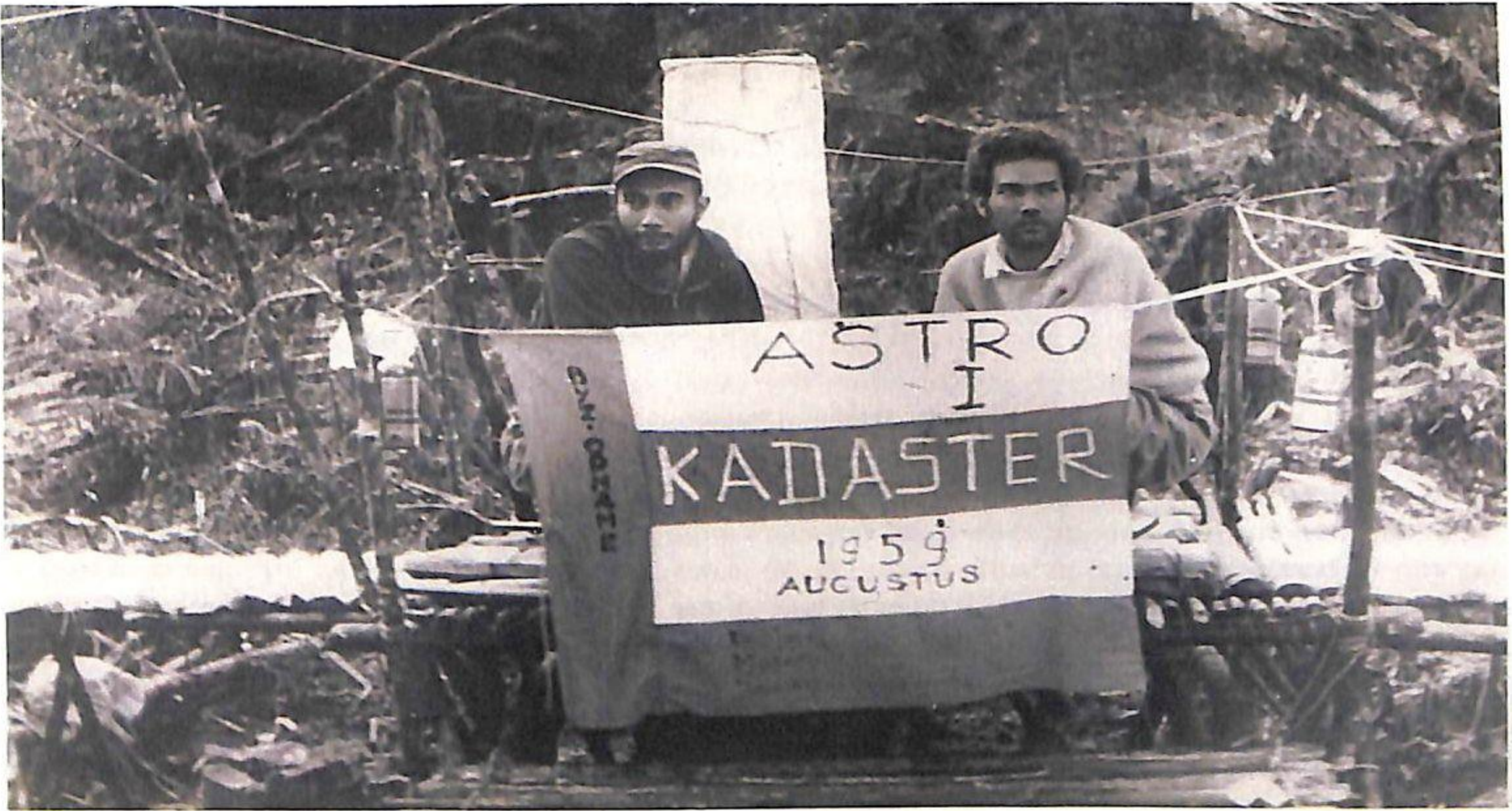
Jongens van de Kadaster te Astro I