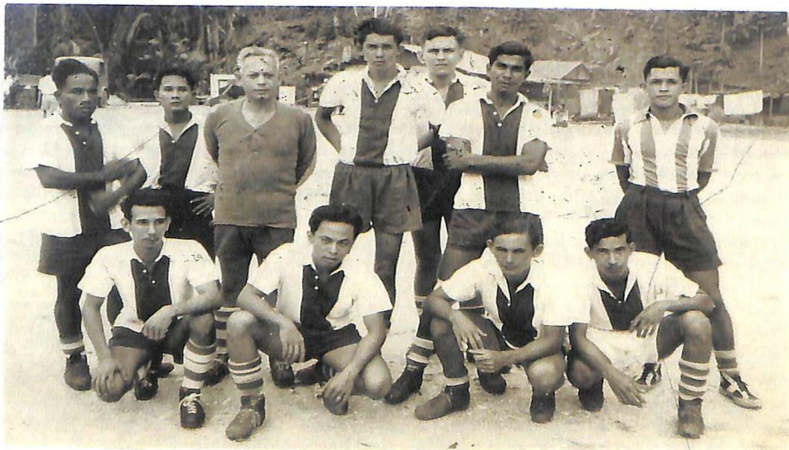
voetbal eftal van W.I.K.