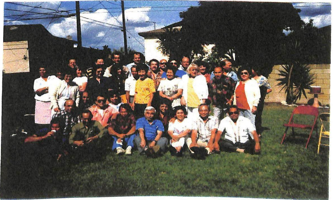
Reunie van een groep Deta-jongens met hun vrouwen te Los Angles (Cal. U.S.A.)