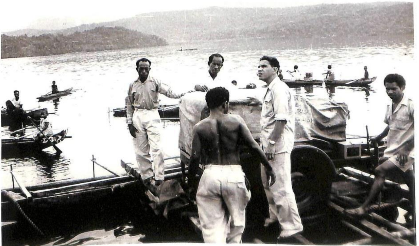
Het op het water klaar maken van apparatuur voor T.B.C. onderzoek.