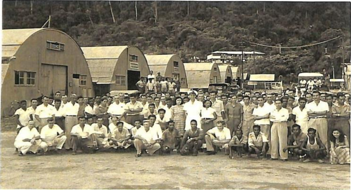
Personeel Gouvernements-Werf Hollandia.