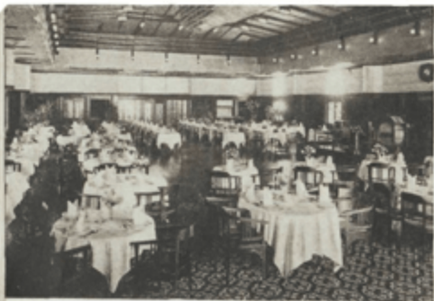
HUIS VAN DEN EERSTEN RANG