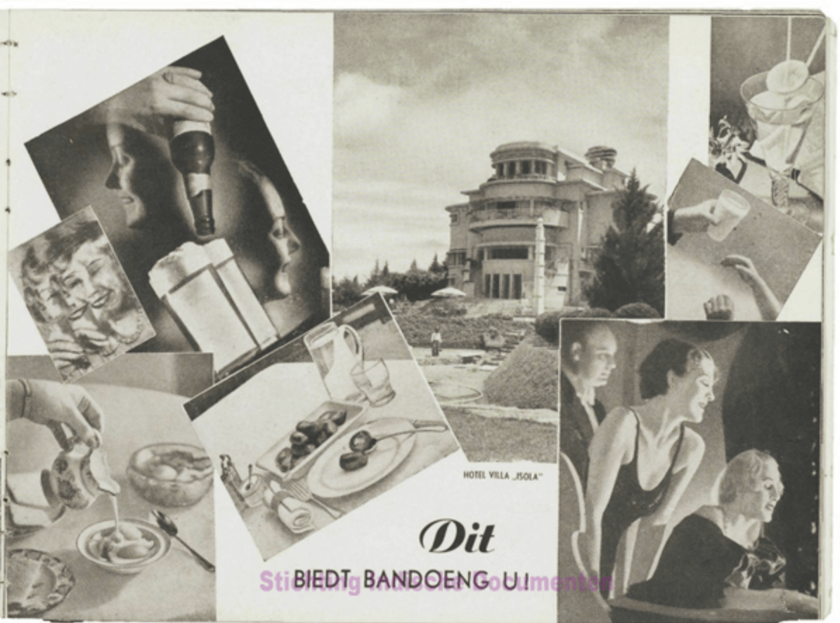
HOTEL VILLA "ISOLA"